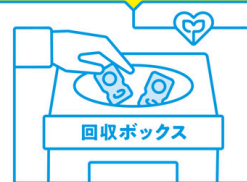
アイシティECOプロジェクト

コンタクトの空ケースを捨てずに/ 持ってくるだけ。 で、地球と社会に貢献できる 空ケースを持ってくる