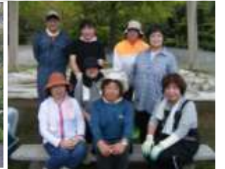
綺麗になりました♪♪